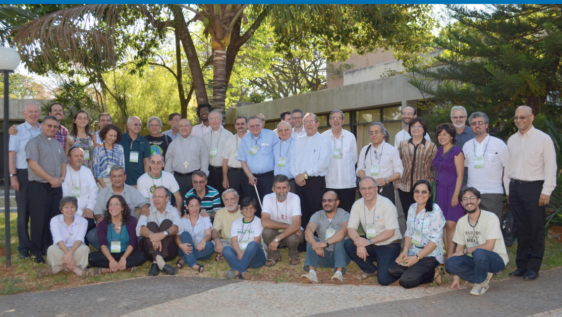
Fotografía de las y los Participantes del Encuentro Fundacional de la REPAM