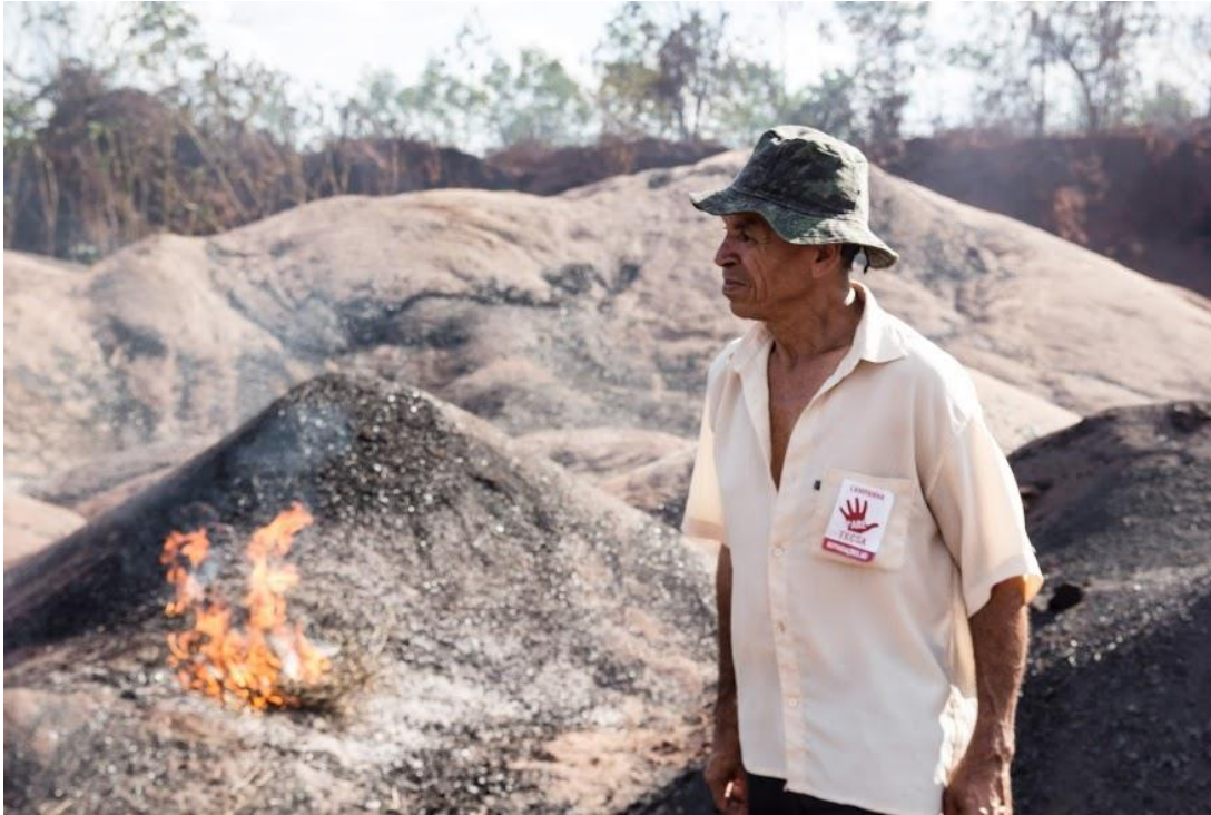
Exposição Respira

Scorie: sono i residui della produzione di guisa e sono depositati incandescenti in luogo aperto e senza recinzione e protezione. Alcune persone e bambini si sono ustionati, lamentando alcuni casi mortali.