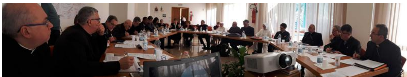
Centro diocesano di spiritualità “San Fidenzio” della diocesi di Verona. 15 febbraio 2019

Il Centro Studi “Missione Emmaus” con sede a Verona ha organizzato, il 15 febbraio scorso presso il centro diocesano di spiritualità “San Fidenzio” (VR), una giornata di studio e di confronto sulle “Nuove ministerialità laicali” per vescovi e vicari di dieci diocesi italiane. L’articolo non è un semplice resoconto dell’incontro ma evidenzia alcuni contenuti emersi e propone alcune piste di lavoro.